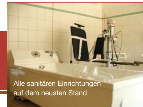
Alle sanitären Einrichtungen auf dem neusten Stand