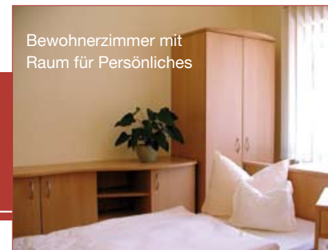
Bewohnerzimmer mit Raum für Persönliches