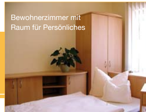
Bewohnerzimmer mit Raum für Persönliches