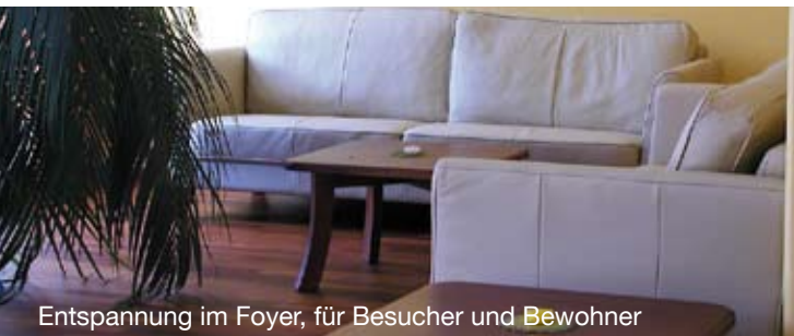
Entspannung im Foyer, für Besucher und Bewohner