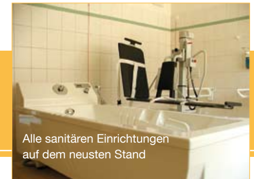
Alle sanitären Einrichtungen auf dem neusten Stand