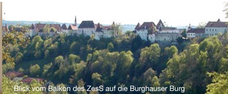
Blick vom Balkon des ZesS auf die Burghausener Burg